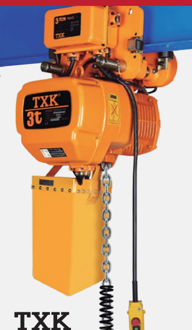
TECLES CON GANCHO Y TROLLEY

Doble voltaje 220/380 ó 220/440 Capacidades de 0.5t - 20t