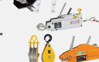
TIRFOR - POLEAS