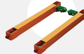
TESTEROS PARA PUENTE GRUA