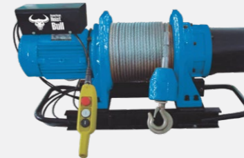
WINCHE INDUSTRIAL 0.3t - 10t