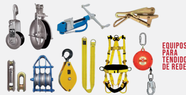
EQUIPOS PARA TENDIDO DE REDES