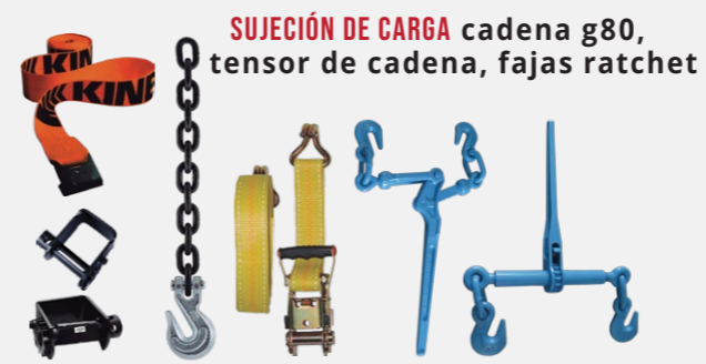
SUJECIÓN DE CARGA cadena g80, tensor de cadena, fajas ratchet