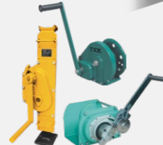
GATAS Y WINCHES